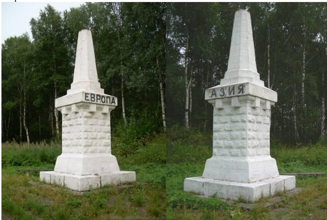
Обелиск Европа-Азия на Транссибе.